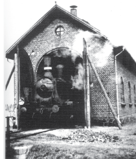
DSB lokomotiv type 11 i remisen i Hejlsminde i 1947-48. Lokomotivet var på tidspunktet indviet af KS. Læs mere om dette senere i bogen. Nedenst ses en smule af drejebænken.