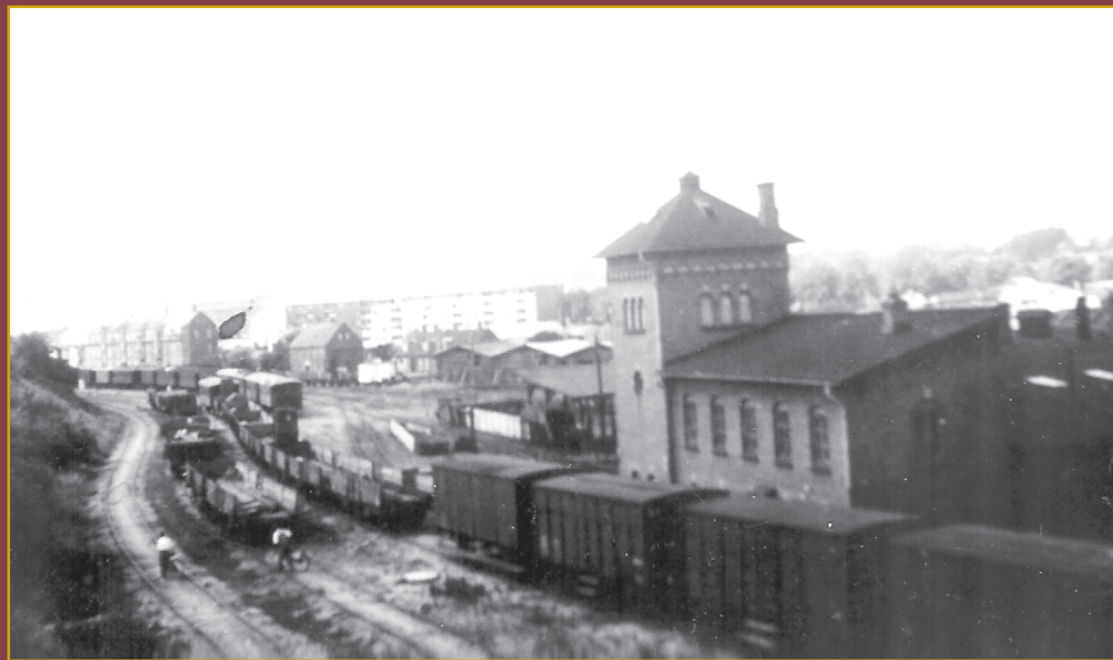
Et allersidste privatfoto taget ned over Kolding Sydbangaard fra broen som førte Osterbrogade over baneterrænet. Vognene er tydeligt oprangeret med henblik på salg. De to stammer af åbne godsvogne, som blev brugt til at optagningen af skinner og sveller ses også. Billedet er formentligt fra omkring 1951.

Et vers skrevet frit efter Tycho Brahe som et farvel til sydbanerne