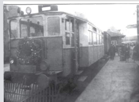
Motorvogn KS M 1 holder ved personen på Kolding Sydbanegaard klar til at køre ud på dens sidste tur med ordinært tog til Vamdrup.

vefsensagtig, og sangmønstret løjede Tøjene ud i Remisen, hvor de nu bliver stående. Et Tidsløst er tilbagelagt. De fleste siger desværre - sagde det i hvert Fald i Gaar!