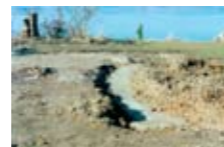
Forfatteren af nærværende bog blev i 2005 bledt om at påvise, hvor drejebænken i Hejlsminde havde ligget. Der blev henført greset i lunden, og resterne af betonfundamentet kom frem. Det tidligere fundament målte 1,7 meter, fordi der skulle bygges et nyt parovhus på stedet.