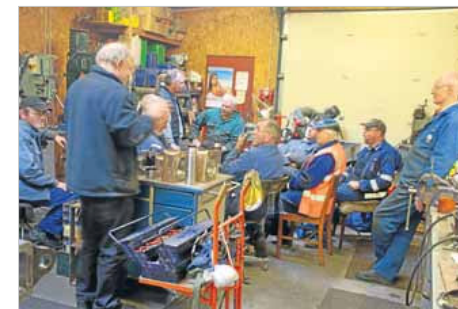
Kaffepausen holdes i remisens eneste opvarmede værksted.