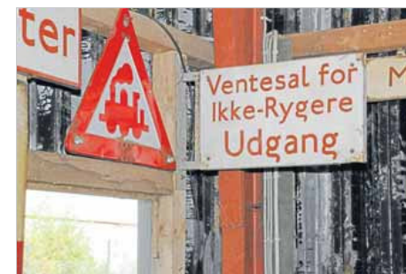
Der var engang, hvor det var ikke-rygerne, der måtte nøjes med særlige rum.