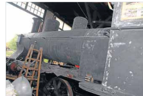
TKVJ 12, der skal være klar til passagerkørsel næste sæson. Om alt og alle vil.