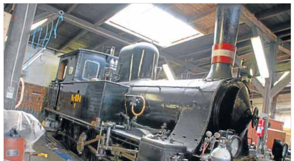
Af Peter Friis Autzen