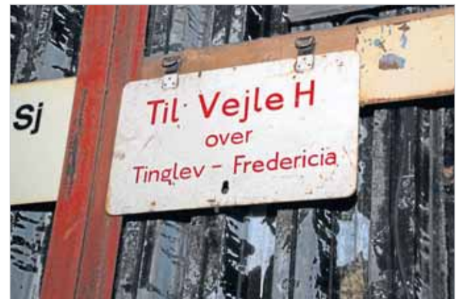
De gamle skilte var af metal og emalje...

- Det har jeg måske sagt før. I flere år, måske endda. Men nu skal det være, siger han.