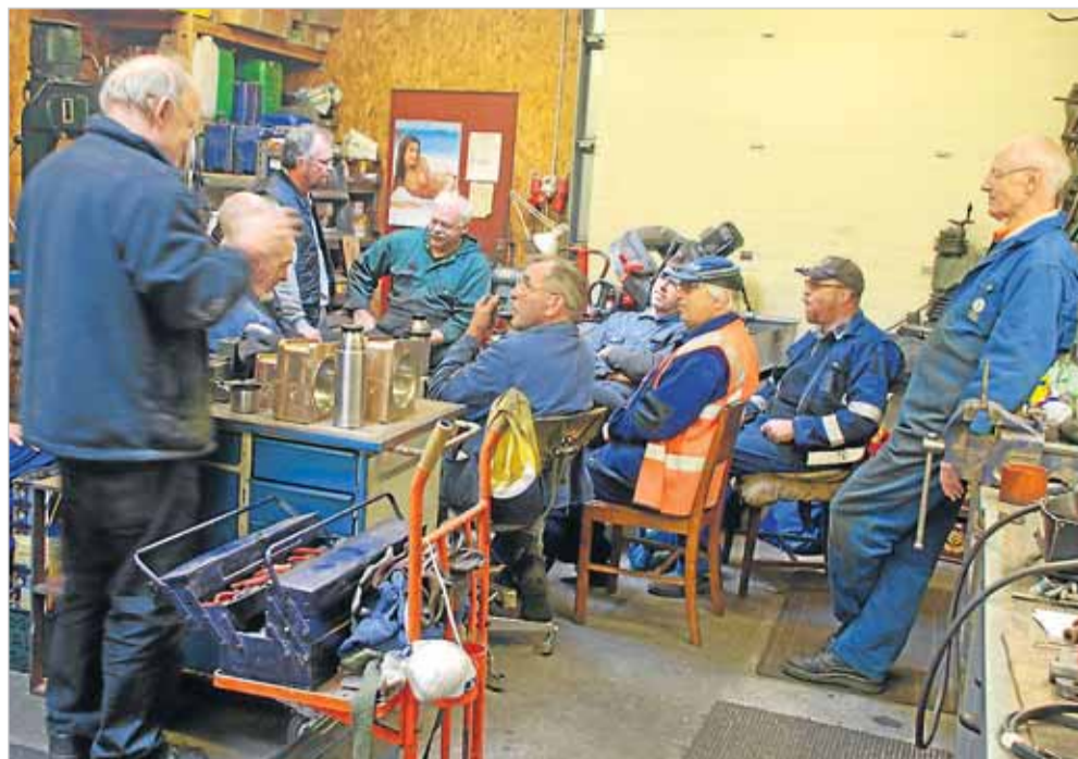
Frokosten bliver indtaget i godt selskab. Alle samles i remisens eneste opvarmede værksted.